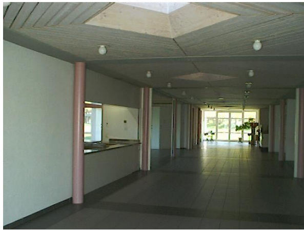
Foyer mit Sitzungszimmer bei verschobenen Wänden