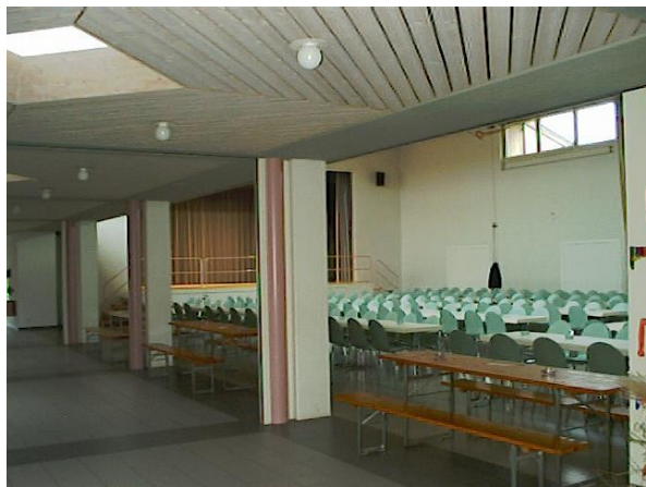
Turnhalle mit Bühne bei verschobenen Wänden